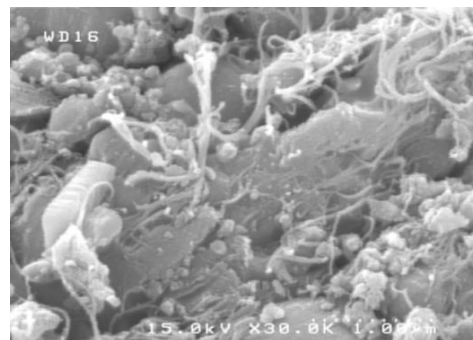
شکل ۱- تصویر میکروسکوپ الکترونی روبشی (SEM) جاذب کامپوزیتی سیلیکاته نانولوله کربنی (CNTs)

در مرحله آزمایشگاهی تحقیق، پس از آماده سازی نمونه بردار تله سوزنی حاوی جاذب نانو ساختار، تأثیر متغیرهای مختلفی چون دما و رطوبت هوای نمونه برداری شده، ثبات نمونه، و عملکرد تجزیه‌ای نمونه بردار مورد بررسی قرار گرفت. جهت آماده سازی تله سوزنی‌های مورد استفاده در تحقیق از سوزن نخاعی شماره ۲۱ با قطر داخلی ۵۲۰ میکرومتر و طول ۱۰ سانتی متر استفاده شد. در فاصله ۳ سانتیمتری از قسمت انتهایی سوزن جهت هدایت گاز حامل در بخش تزریق دستگاه کروماتوگرافی گازی، بداخل سوزن سوراخ جانبی به قطر ۰/۴ میلی‌متر تعبیه شد. بعد از تهیه و آماده سازی جاذب نانو ساختار، ۱/۵ سانتیمتر از طول سوزن به فاصله ۰/۸ سانتیمتر از قسمت انتهایی توسط جاذب پر شد، سپس برای تثبیت و جلوگیری از ریزش جاذب، از دو طرف با استفاده از پشم شیشه به طول ۳ میلی‌متر مهار گردید (شکل ۱).