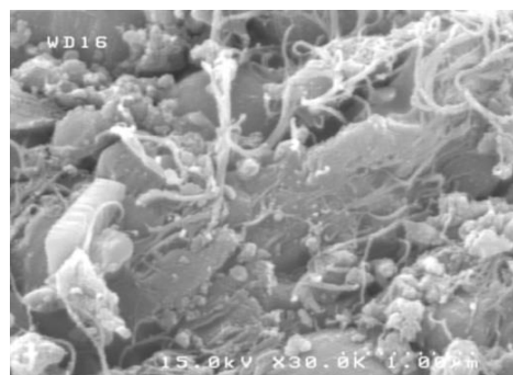
شکل ۱- تصویر میکروسکوپ الکترونی روبشی (SEM) جاذب کامپوزیتی سیلیکاته نانولوله کربنی (CNTs)

در مرحله آزمایشگاهی تحقیق، پس از آماده سازی نمونه بردار تله سوزنی حاوی جاذب نانو ساختار، تأثیر متغیرهای مختلفی چون دما و رطوبت هوای نمونه برداری شده، ثبات نمونه، و عملکرد تجزیه‌ای نمونه بردار مورد بررسی قرار گرفت. جهت آماده سازی تله سوزنی‌های مورد استفاده در تحقیق از سوزن نخاعی شماره ۲۱ با قطر داخلی ۵۲۰ میکرومتر و طول ۱۰ سانتی متر استفاده شد. در فاصله ۳ سانتیمتری از قسمت انتهایی سوزن جهت هدایت گاز حامل در بخش تزریق دستگاه کروماتوگرافی گازی، بداخل سوزن سوراخ جانبی به قطر ۰/۴ میلی‌متر تعبیه شد. بعد از تهیه و آماده سازی جاذب نانو ساختار، ۱/۵ سانتیمتر از طول سوزن به فاصله ۰/۸ سانتیمتر از قسمت انتهایی توسط جاذب پر شد، سپس برای تثبیت و جلوگیری از ریزش جاذب، از دو طرف با استفاده از پشم شیشه به طول ۳ میلی‌متر مهار گردید (شکل ۱).