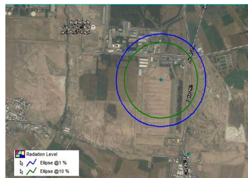
شکل ۳- خطوط گسترش درصد مرگ‌ومیر در نتیجه آتش کروی (ماه‌های گرم)