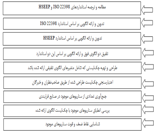
شکل ۱- مراحل انجام مطالعه

میزان انطباق سناریوهای مورد بررسی با زیربندهای مختلف الگوی پیشنهادی در جدول ۱ ارائه گردیده است. فراوانی انطباق و عدم انطباق سناریوهای مورد بررسی در قالب مراحل اصلی الگوی پیشنهادی نیز در شکل ۳ ارائه گردیده است. نتایج نشان داد در بین سناریوهای مورد بررسی فقط زیربندهای آماده‌سازی سناریو و اجرای مانور به‌صورت کامل در کلیه سناریوها لحاظ گردیده بود (۱۰۰ درصد منطبق). از بین زیربندهای مرحله ایجاد بستر و زیربنای مناسب، تعیین زمان پروژه، تعیین چارچوب ملور، گپ آنالیز و ارزیابی نیازها، تشکیل تیم طرح‌ریزی، جلب حمایت مدیریت، تعیین اهداف طراحی، مدیریت تیم طراحی، مدیریت ریسک و امنیت اطلاعات، جنبه‌های محیطی، آمادگی، جنسیت و تنوع، لحاظ کردن لجستیک تامین تست و ارتباطات، تعیین نوع سناریو، انتخاب روش مانور، تعیین قابلیت‌ها، وظایف و اهداف، تهیه برنامه تداخلی، آماده سازی سناریو، تهیه شرح سناریو، تامین سناریو، تامین وسایل واقعی سازی سناریو، مستندات تهیه سناریو، جلسه توجیهی استارت آپ، توجیه مشارکت کنندگان، تنظیم صحنه مانور، راه اندازی مانور، اجرای مانور، مشاهدات ثبت، هات واژن جلسه، ارزیابیها و کنترلها، جلسه ارزیابی، بررسیهای پس از مشاهده، تعیین روش ارزیابی، طرح‌ریزی، ارزیابی، انجام ارزیابی، جمع داده‌ها، تجزیه تحلیل داده‌ها، تهیه اقدامات اصلاحی، بازنگری مدیریت، های بهبود برنامه، پیگیری اجرا