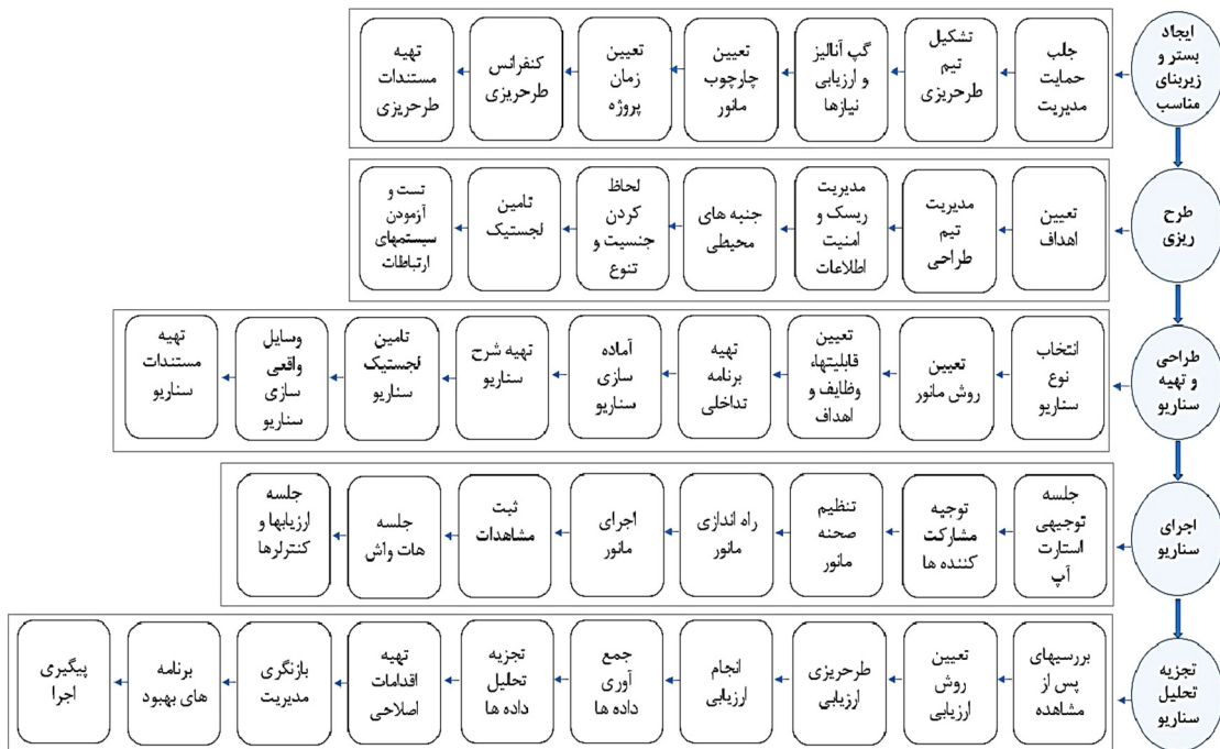
شکل ۲- مراحل الگوی پیشنهادی

نتایج حاصل از استخراج الگو از دو استاندارد مورد بررسی نشان داد که الگوی پیشنهادی شامل ۵ مرحله اصلی و ۴۱ زیربند می‌باشد. ۵ مرحله اصلی الگوی