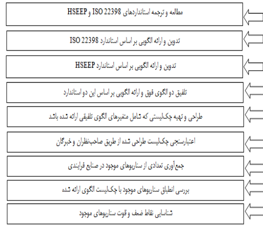
شکل ۱- مراحل انجام مطالعه

میزان انطباق سناریوهای مورد بررسی با زیربندهای مختلف الگوی پیشنهادی در جدول ۱ ارائه گردیده است. فراوانی انطباق و عدم انطباق سناریوهای مورد بررسی در قالب مراحل اصلی الگوی پیشنهادی نیز در شکل ۳ ارائه گردیده است. نتایج نشان داد در بین سناریوهای مورد بررسی فقط زیربندهای آماده‌سازی سناریو و اجرای مانور به‌صورت کامل در کلیه سناریوها لحاظ گردیده بود (۱۰۰ درصد منطبق). از بین زیربندهای مرحله ایجاد بستر و زیربنای مناسب، تعیین زمان پروژه، تعیین چارچوب ملور، گپ آنالیز و ارزیابی نیازها، تشکیل تیم طرح‌ریزی، جلب حمایت مدیریت، تعیین اهداف طراحی، مدیریت تیم طراحی، مدیریت امنیت و ریسک و اطلاعات جنبه‌های محیطی، لحاظ کردن جنسیت و تنوع، لجستیک تامین، تست و ارتباطات سیستمهای آزمون و ارتباطات، انتخاب نوع سناریو، تعیین روش مانور، تعیین قابلیت‌ها، وظایف و اهداف، تهیه برنامه تداعی، آماده سازی سناریو، تهیه شرح سناریو، تامین سناریو، وسایل واقعی سازی سناریو، مستندات سناریو، تهیه مستندات، جلسه توجیهی استارت آپ، توجیه مشارکت کنندگان، تنظیم صحنه مانور، راه اندازی مانور، اجرای مانور، مشاهدات ثبت، هات واژن جلسه، ارزیابیها و کنترلرها، جلسه بررسیهای پس از مشاهده، تعیین روش ارزیابی، طرح‌ریزی، ارزیابی، انجام ارزیابی، جمع داده‌ها، تجزیه تحلیل داده‌ها، اقدامات اصلاحی، تهیه بازنگری مدیریت، های بهبود برنامه، پیگیری اجرا