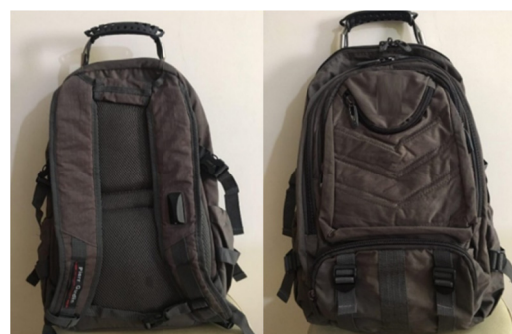
شکل ۲- کوله پشتی رایج

میانگین وزن بدن را در هر یک از کوله‌پشتی‌های طراحی شده و رایج در ۳ حالت استاتیک و دینامیک و تعادل حمل کرد. داخل هر کوله‌پشتی کتاب‌های مختلف با وزن مشخص قرار داده شد. میانگین وزن حمل شده توسط شرکت‌کنندگان ۵/۵۶ کیلوگرم بود. کوله‌پشتی‌ها تا حد امکان نزدیک به بدن قرار داده شدند و بندهای ناحیه‌ی شانه به صورتی تنظیم شد که قسمت انتهایی کوله‌پشتی در گودی کمر قرار گرفته باشد. اندازه‌گیری فشار طی راه رفتن با روش قدم‌میان‌ی صورت گرفت. به این منظور از فرد خواسته شد مسیر مشخصی را که در میانه‌ی آن صفحه حساس به فشار قرار دارد، با سرعت راه رفتن طبیعی خود در راستای مستقیم طی کند و برای هر پا به صورت جدا ثبت فشار صورت گرفت. جهت اندازه‌گیری فشار در حالت ایستاده از فرد درخواست شد روی صفحه اندازه‌گیری فشار بایستد و به یک نقطه‌ی ثابت روی دیوار رو به رو به مدت ۱۰ ثانیه نگاه کند. وقتی فشار روی یک پا ۵۰ درصد کل فشار بود اندازه‌گیری ثبت شد.