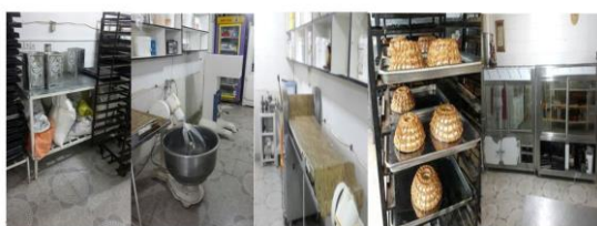
شکل ۱- فرآیند تولید محصولات قنادی الف: مواد اولیه ب: دستگاه مخلوط کن ج: دستگاه پهن کن د و ه: آماده سازی جهت عرضه به بازار

در مطالعه حاضر ابتدا با مشاهده پرونده پزشکی و انجام مصاحبه، کارگران از وجود هر نوع بیماری و مصرف دارو پایش شدند و چنانچه دارای بیماری‌هایی از قبیل: عفونت یا تب، مشکلات ریوی، کلیوی، قلبی - عروقی، پرکاری غده تیروئید، دیابت، اسهال یا استفراغ، سابقه ابتلا به بیماری‌ها و اختلالات ناشی از مواجهه با گرما و همچنین مصرف داروهایی از قبیل: بتابلوکرها، فنوتیازین، دیورتیک، آنتی کوسینرژیک، آنتی اسپاسمودیک، سایکوتروپیک، آنتی هیستامین‌ها، ضد