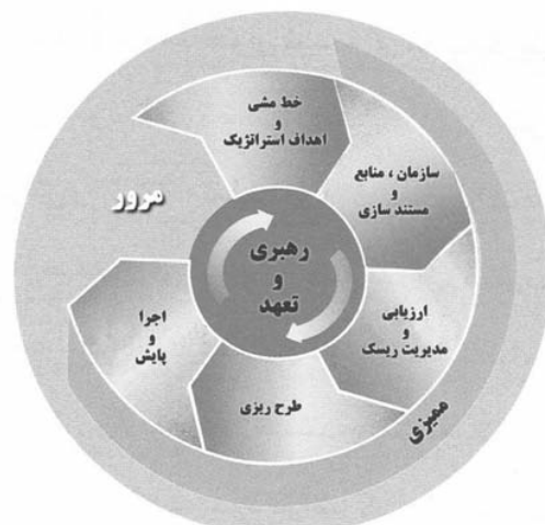
شکل ۱- مدل رایج HSE-MS

ممیزی و بازنگری باید به منظور تایید اجرا و اثر بخشی سیستم مدیریت HSE و تناسب آن با الزامات