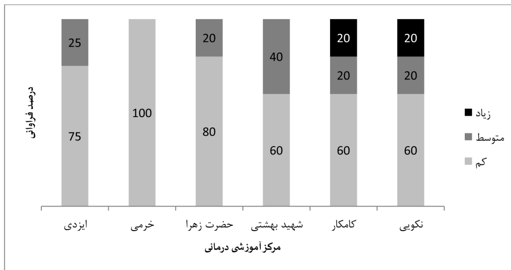
نمودار ۲- درصد فراوانی ریسک مواجهه شغلی با مواد شیمیایی در آزمایشگاهها به تفکیک بیمارستانها

میکروبیولوژی مراکز حضرت زهرا (س) و نکویی با عدد نهایی ریسک ۱ (رتبه ی خطر ۱ و رتبه ی مواجهه ۱) می باشد. همچنین نتایج این مطالعه نشان داد که مرکز آموزشی درمانی خرمی کمترین میزان ریسک مواجهه شغلی با مواد شیمیایی در آزمایشگاهها را داراست. در نمودار شماره ۲ درصد فراوانی ریسک مواجهه شغلی با مواد شیمیایی در آزمایشگاهها به تفکیک بیمارستانهای مورد بررسی ارائه شده است. همچنین آزمون من- ویتنی اختلاف معنی داری بین