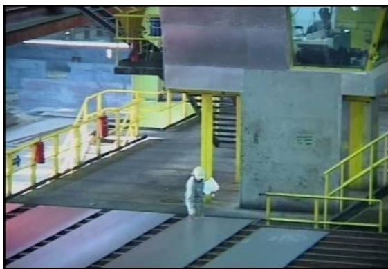
تصویر ۱: ثبت کد بر روی ورقه های نورد شده در بخش بسترهای خنک کننده

در ارتباط با کنترل تنش های گرمایی در قدم اول، لازم است با برنامه ریزی صحیح از مواجهه با شرایطی که می تواند منجر به تنش گرمایی شود، اجتناب نموده و یا اینکه آن را به حداقل رساند. اگر امکان عدم مواجهه با گرما وجود نداشته باشد، لازم است که میزان خطر، ترجیحاً از طریق کنترل های محیطی، به حد قابل قبول کاهش یافته و کنترل گردد. در مواردی که علی رغم کنترل های محیطی، احتمال تنش های گرما وجود داشته باشد، باید احتیاطات اضافی دیگری از قبیل به کارگیری معیارهای پزشکی در انتخاب و سازش افراد، تهیه نوشیدنی های مناسب جهت جلوگیری از کم آبی بدن، آموزش، محدود کردن دوره های کار و تامین لباس های حفاظتی حرارتی، می توان میزان مخاطرات را کاهش داد. از طریق تهویه