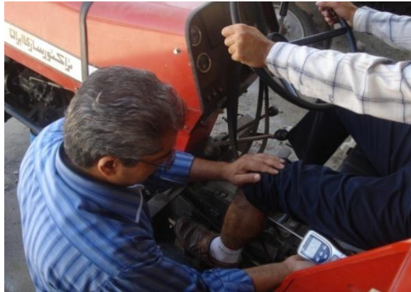
شکل ۱- استفاده از دستگاه الگومتر در ناحیه عضله گاستروکنیمیوس برای تعیین آستانه درد

درد کاربر در این مرحله نیز ثبت شد. کاهش آستانه درد عبارت است از: آستانه درد قبل از کلاچ‌گیری منهای آستانه درد کاربر بعد از کلاچ‌گیری. کاهش هر چه بیش‌تر آستانه درد نشان می‌دهد که عضله در فرآیند کلاچ‌گیری تحت تنش بیش‌تری قرار گرفته است. تمامی اندازه‌گیری‌ها با رعایت فواصل زمانی مناسب بین آزمایش‌های مختلف صورت گرفت. با توجه به این‌که کلاچ تراکتور MF285 دو مرحله‌ای است، برای جلوگیری از خطای احتمالی، با قرار دادن مانع فلزی زیر پدال از اعمال نیروی مازاد و رفتن به مرحله دوم کلاچ‌گیری جلوگیری شد. در تحلیل رگرسیونی مورد استفاده، تأثیر متغیرهای مستقل شامل: شاخص BMI، زاویه زانو، زاویه مچ و ران پا (به ترتیب X_1 ، X_2 ، X_3 و X_4 ) بر کاهش آستانه درد به‌عنوان متغیر وابسته (Y) بررسی شد. داده‌ها با استفاده از نرم‌افزار JMP4 تجزیه و تحلیل شدند.