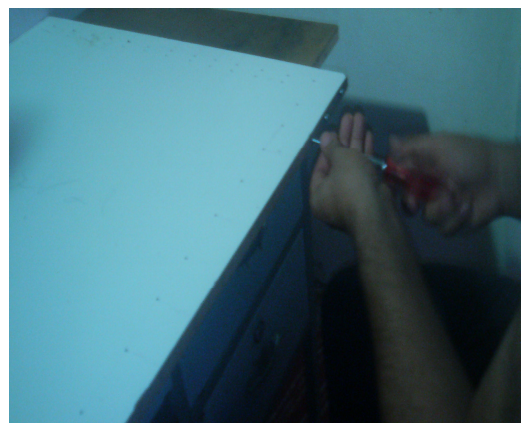
شکل ۱: تصویری از موقعیت آزمایش

یافته‌های حاصله از آزمایش، در جداول ۲، ۳ و ۴ آورده شده است. مطابق آزمون فیشر ( p\text{-value} < 0/05 ) اختلاف LPD سه نوع پیچ گوشتی معنی دار نیست. اما میزان