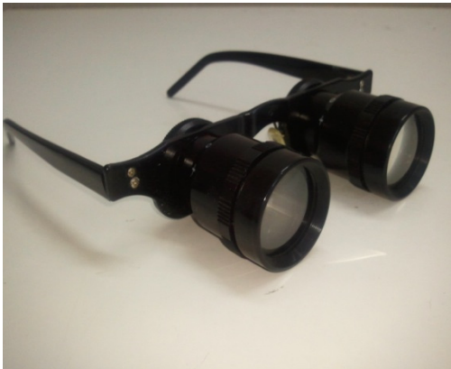
شکل ۱: لنز بزرگنمایی چشمی مورد استفاده در مطالعه.

شیفت کار ماکول نشد، زیرا افراد در ساعت آخر به ضبط و ربط ایستگاه کار خود پرداخته و دیگر به کار اصلی خود یعنی مونتاژ مدارهای الکترونیکی نمی‌پردازند.