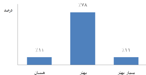
نمودار ۳- نظر مونتاژکاران در مورد شرایط کار هنگام استفاده از لنز بزرگنمایی در مقایسه با قبل (n=۷۳).

کار قبل از مداخله بوده است. این موضوع گویای آنست که مداخله (استفاده از لنز بزرگنمایی چشمی) تاثیر قابل توجه و معنی داری در کاسته شدن از شدت ناراحتی در نواحی یاد شده داشته و از اینرو به نظر می‌رسد در کاهش وقوع اختلالات در این نواحی موثر باشد. در مطالعات مختلفی که بر روی تاثیر استفاده از لنز بزرگنمایی بر بهبود پوسچر دندانپزشکان انجام شد، مشخص گردید که استفاده از این لنزها تاثیر چشمگیری بر بهبود پوسچر نواحی گردن و تنه دارد