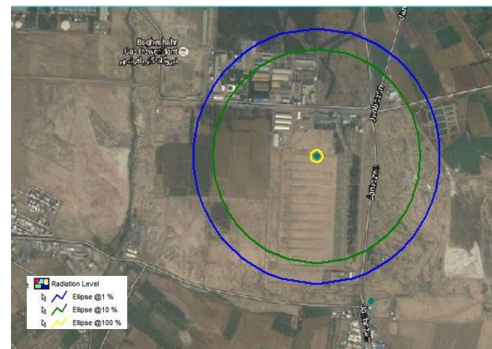
شکل ۲- خطوط گسترش درصد مرگ‌ومیر در نتیجه آتش کروی (ماه‌های سرد)

پیامدهای اصلی واحد ذخیره‌سازی گاز مایع شامل آتش کروی، آتش ناگهانی، آتش فورانی و انفجار است، با توجه به این‌که گاز مایع در شرایط فشار و دمای عادی به‌صورت گاز است، بنابراین امکان وقوع آتش استخری (Pool Fire) در این تأسیسات وجود ندارد. با توجه به نتایج به‌دست‌آمده، در اثر سناریوی اول پیامدهای آتش کروی، انفجار و آتش ناگهانی محتمل هستند. در اثر پیامد آتش کروی در بدترین حالت ممکن تا شعاع ۲۹۰