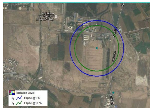
شکل ۳- خطوط گسترش درصد مرگ‌ومیر در نتیجه آتش کروی (ماه‌های گرم)