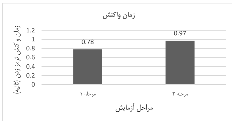
نمودار ۲- زمان واکنش ترمز زدن

رانندگان صورت می‌گیرد باشد ( p < 0.003 )، t(58) = 3.255 .