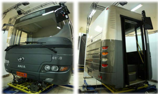
شکل ۳- شبیه‌ساز رانندگی اتوبوس آکیا BI 301 Full

شبیه‌ساز رانندگی اتوبوس آکیا BI 301 Full: شبیه‌ساز رانندگی اتوبوس آکیا BI 301 Full توسط دانشگاه خواجه نصیر ساخته شده است برای ارزیابی عملکرد رانندگان استفاده شد (شکل ۳). شبیه‌سازی کلیه ویژگی تعامل راننده با ماشین را دارد که در آن راننده سرعت و جهت اتوبوس را کنترل می‌کند و بازخورد بصری و شنیداری را برای رانندگان فراهم می‌کند. از نظر سخت افزاری شبیه‌ساز آکیا دارای اتاق و بدنه کامل تا پشت سر راننده شامل داشبورد، آمپرهای، صندلی راننده، کمر بند ایمنی، فرمان، دکمه‌های دنده خودکار، کلیدهای باز و بست درها، ترمزدستی، شیشه‌ها، درب بادی ورودی مسافر و راننده و غیره بود. سیستم نمایش شامل یک عدد پرده نیم‌استوانه ۱۸۰ درجه به همراه سه عدد ویدیو پروژکتور سه بعدی با تابش از جلو، دو عدد LCD 18.5" به‌عنوان آینه‌های جانبی و یک عدد LCD 17" به‌عنوان آینه عقب می‌باشد. از بعد نرم افزاری این شبیه‌ساز قابلیت تهیه انواع مختلف وظایف رانندگی، حوادث ترافیکی پیچیده، کلیه سناریوهای رانندگی و ثبت داده‌های مربوط به عملکرد هر یک از راننده که شامل موقعیت در باند، شتاب و سرعت اتوبوس، زمان واکنش ترمز زدن، تعداد تصادفات، موقعیت نسبت به دیگر خودرو و غیره می‌باشد.