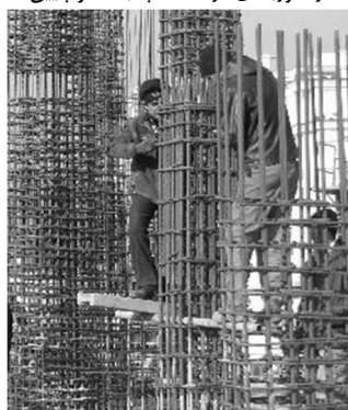
آرما توری بندی ایستاده و در ارتفاع شانه