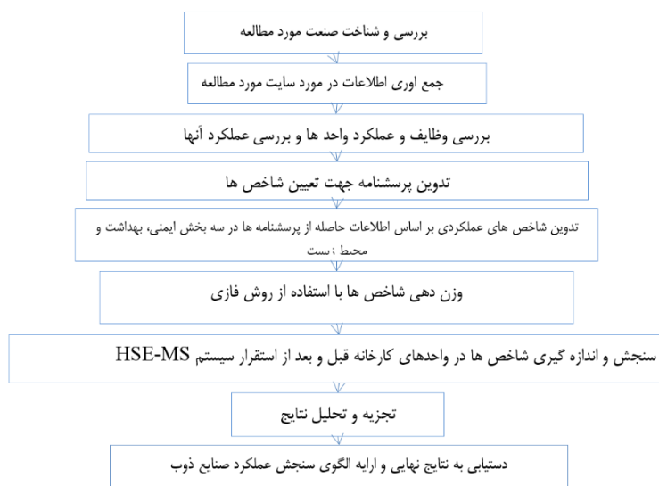
شکل ۱- الگوریتم مراحل انجام تحقیق

گری تفکیک شده اند. جهت کمی سازی وزن شاخص های عملکردی از روش فازی استفاده شده است. سپس به اندازه گیری شاخص ها در محیط مورد مطالعه پرداخته شده است. در نهایت با مشخص شدن میزان وزن شاخص ها با استفاده از روش های آماری بر اساس مستندات موجود در شرکت بین شرایطی که سیستم های HSE پیاده شده یا خیر با استفاده از آزمون T.testpair آنالیز گردیده است. در نهایت به بررسی شاخص ها در قبل و بعد از استقرار سیستم HSE-MS پرداخته می شود. بر این اساس مشخص می شود که ارتباط معناداری میان شاخص ها و عملکرد واحد HSE وجود دارد.