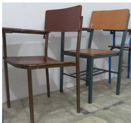
شکل ۱- تصویری از صندلی‌های مورد استفاده در دانش‌آموزان

شده ۳۷ سانتی‌متر انتخاب گردید که با ۲۴/۸ درصد از ابعاد دانش‌آموزان دختر و ۱۹/۱ درصد از ابعاد دانش‌آموزان پسر متناسب می‌باشد. پهنای صندلی طراحی شده ۲۷ سانتی‌متر انتخاب گردید که مطابق با استاندارد طراحی، به صدک ۹۵ پهنای باسن نزدیک می‌باشد. مقدار تعیین شده به ترتیب با ۱۵ و ۱۳/۶ درصد از ابعاد آنترپومتریک دانش‌آموز دختر و پسر تناسب دارد. ارتفاع پشتی صندلی می‌تواند با توجه به نوع طراحی صندلی کوتاه، متوسط و بلند باشد و بایستی فشار وارده را در حداکثر سطح ممکن توزیع نماید بنابراین ارتفاع پشتی صندلی ۴۲ سانتی‌متر انتخاب گردید که در مقایسه با صندلی‌های مورد استفاده درصد تناسب آن در دانش‌آموزان دختر و پسر ۲۱/۲ و ۱۴/۸ درصد می‌باشد. با توجه به اطلاعات مربوط به صدک پنجاهم ارتفاع آرنج، ارتفاع ۱۹ سانتی‌متر برای ارتفاع دسته صندلی دانش‌آموزان ۹ ساله انتخاب گردید که به ترتیب با ۴۲/۵ و ۳۹/۵ درصد ابعاد آنترپومتریک دختران و پسران تناسب دارد. با توجه به اندازه ارتفاع رکیب دانش‌آموزان پایه ششم، مقدار قابل قبول ارتفاع نشستنگاه ۴۳ سانتی‌متر تعیین