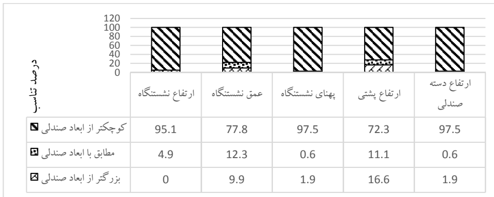
نمودار ۲- درصد تناسب ابعاد آنتروپومتریک دانش‌آموزان پسر پایه سوم با صندلی‌های مورد استفاده

گرفتن صدک ۵ طول کفل رکبی، عمق نشستگاه جهت طراحی صندلی ایده آل ۳۷ سانتی‌متر در نظر گرفته شد. همچنین ارتفاع پشتی صندلی‌های مورد استفاده برای دختران و پسران ۹ ساله به ترتیب ۴۲ و ۴۵ سانتی‌متر بود. از آنجایی که صدک ۵۰ ارتفاع شانه جهت طراحی این بخش از صندلی در نظر گرفته می‌شود. ارتفاع پشتی صندلی ۴۲ سانتی‌متر در نظر