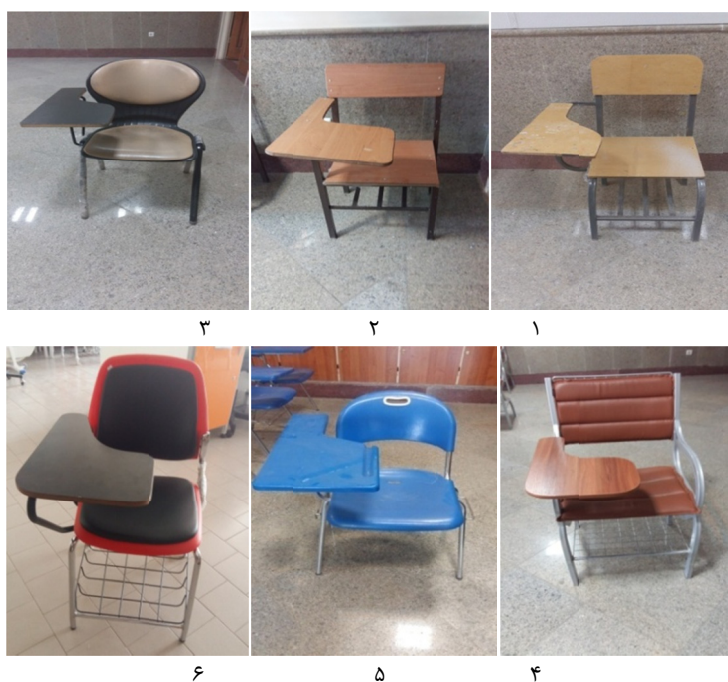
شکل ۱- صندلی‌های مورد ارزیابی جهت بررسی رضایت‌مندی دانشجویان در مطالعه حاضر

این صندلی‌ها خشنود بودند. در رابطه با سایر صندلی‌ها خشنودی کامل بسیار کم بوده و بیش‌ترین درصد رضایت کامل در صندلی شماره ۳ مشاهده گردید. میزان رضایت از تک تک ابعاد صندلی‌ها نیز در جدول ۲ نشان داده شده است. بنا بر این جدول، بیش‌ترین درصد رضایت از ابعاد مختلف صندلی، به صندلی‌های ۶ و ۴ اختصاص یافت. البته لازم به ذکر