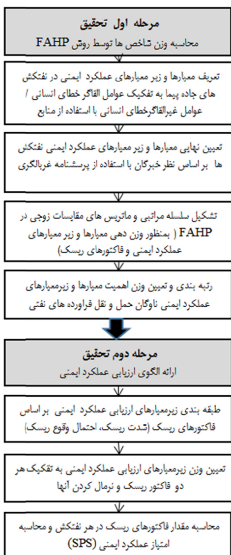
شکل ۱- مراحل اصلی مطالعه

الفاکر خطای انسانی" و "عوامل فنی غیر الفاکر خطای انسانی" مورد مطالعه قرار گرفت. مراحل انجام این تحقیق بر اساس اطلاعات جمع آوری شده از واحد HSE شرکت پخش فرآورده‌های نفتی ایران، نظر تیم خبرگان، آمار حوادث، مشاهده و ممیزی، منابع کتابخانه‌ای در دو گام اصلی انجام گرفت. مراحل انجام این تحقیق در شکل ۱ نشان داده شده است.