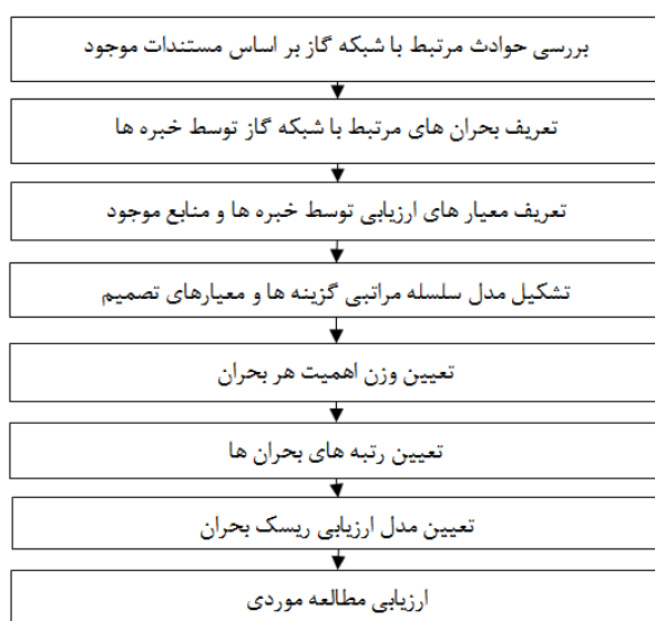
شکل ۱- مراحل انجام تحقیق

HSE در صنعت گاز داشته باشد. در این تحقیق ۱۷ نفر بعنوان خبره تعریف گردید. متوسط سن خبره ها ۴۳ سال و همگی دارای مدرک لیسانس به بالا بوده. ۱۴ نفر مرد و ۳ نفر زن بوده است. تمامی آنها دارای حداقل ۵ سال سابقه کار در شرکت‌های گاز را داشته‌اند و آشنایی با روش های تصمیم گیری و پرسشنامه های مربوطه داشته‌اند. ملاک انتخاب خبره‌ها سابقه کار در حوزه مرتبط، مدرک تحصیلی مرتبط (HSE)، مهندسی صنایع، ایمنی و بهداشت حرفه‌ای) و دوره‌های گذرانده شده توسط فرد بود. همچنین در خصوص تکمیل پرسشنامه‌ها به آنها آموزش‌های لازم توسط محقق داده شد.