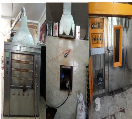
شکل ۲- انواع فرهای قنادی الف: فر طبقه‌ای ب: فر کوره‌ای ج: فر گردان (دوار)

کرد (۲۵، ۲۶). برای تعیین شاخص بهینه هم می‌توان از پارامترهای فیزیولوژیک استفاده کرد که دمای دهانی یکی از پارامترهای مهم برای اعتبارسنجی شاخص‌ها محسوب می‌شود (۲۳).