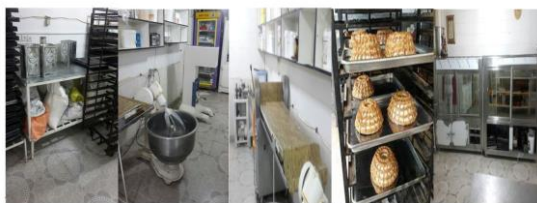
شکل ۱- فرآیند تولید محصولات قنادی الف: مواد اولیه ب: دستگاه مخلوط کن ج: دستگاه پهن کن د و ه: آماده سازی جهت عرضه به بازار

در مطالعه حاضر ابتدا با مشاهده پرونده پزشکی و انجام مصاحبه، کارگران از وجود هر نوع بیماری و مصرف دارو پایش شدند و چنانچه دارای بیماری‌هایی از قبیل: عفونت یا تب، مشکلات ریوی، کلیوی، قلبی - عروقی، پرکاری غده تیروئید، دیابت، اسهال یا استفراغ، سابقه ابتلا به بیماری‌ها و اختلالات ناشی از مواجهه با گرما و همچنین مصرف داروهایی از قبیل: بتابلوکرها، فنوتیازین، دیورتیک، آنتی کوسینرژیک، آنتی اسپاسمودیک، سایکوتروپیک، آنتی هیستامین‌ها، ضد