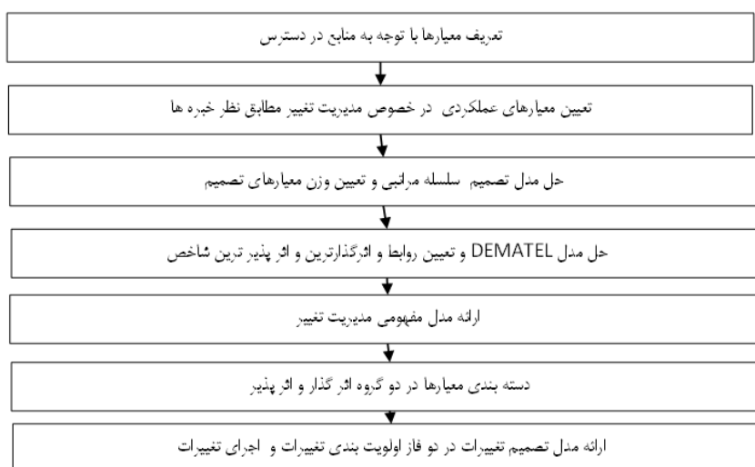
شکل ۱- مراحل انجام تحقیق