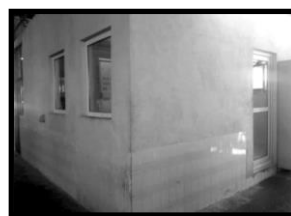
شکل ۴- نمونه مداخلات کنترل صدا در اتاق کنترل واحد تولید؛ سمت راست بعد از اصلاح و سمت چپ قبل از اصلاح