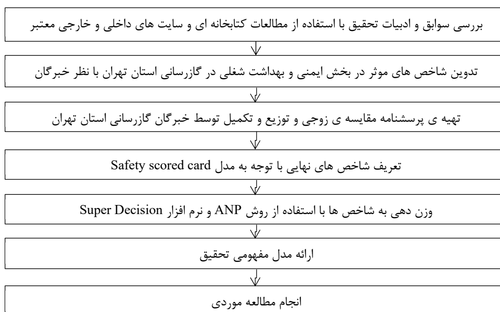
شکل ۱. مراحل انجام تحقیق

و مستعان در سال ۱۳۸۸ در تحقیق خود به این نتیجه رسیدند که در ارزیابی حوزه ی HSE صرفاً نباید به شاخص های پیرو و تابع که ارائه دهنده نتایج هستند اکتفا نمود بلکه اقداماتی را که به این نتایج ختم می شوند را نیز باید مورد سنجش قرار داد (۲۶). منصوری و عظیمی حسینی در سال ۱۳۹۴ به ارزیابی کمی شرکت های گاز از لحاظ وضعیت عملکرد سیستم مدیریت HSE و رتبه بندی آنها به کمک روش تصمیم گیری چند شاخصه پرداخته اند تا بدین وسیله ضمن نمایان ساختن نکات ضعف و قوت هر یک، انگیزه ی لازم برای رقابت و ارتقای هر چه بیشتر سطح مدیریت HSE آنها فراهم گردد (۱۸). امیدواری و لشگری در سال ۲۰۱۴ به تاثیر قضاوت های شخصی و ارزیابی های کیفی در سیستم های ارزیابی عملکرد HSE اشاره نموده و عنوان نموده اند که ایجاد ساختارهای مهندسی و ریاضی می تواند در افزایش دقت ارزیابی عملکرد موثر باشد (۲۷). Juglaret و همکاران در سال ۲۰۱۱ در پژوهش خود به این نتیجه رسیدند که شاخص های سنتی OHS، اگرچه برای اعتبارسنجی یک استراتژی طولانی مدت OHS و ترویج و ارتقاء یادگیری سازمانی لازم است، اما برای برآورده کردن یک سیستم مدیریت ایمنی فعال یا پیشگیرانه کافی نیستند (۷). Rivera و Dudics در سال ۲۰۰۶ بیان نمودند که اگر فقط دیدگاه پس نگر و استفاده از بررسی نرخ حوادث ثبت شده و نرخ خرابی در کارها باشد، حرکت به جلو امکان پذیر نخواهد بود (۲۸). Reiman و Pietikäinen در سال ۲۰۱۲ به این نتیجه رسیدند که شاخص های ایمنی می تواند نقش کلیدی در فراهم کردن