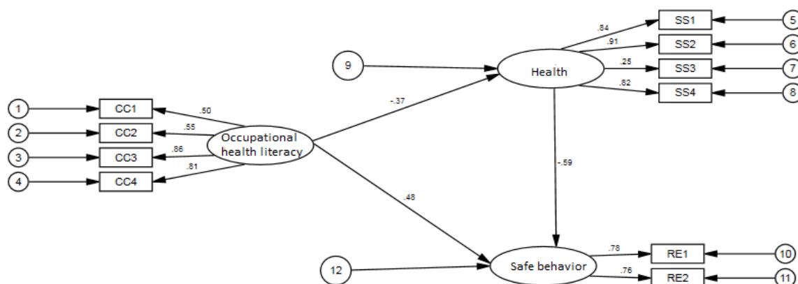
Figure 1. Fitted model for the study of occupational health literacy and safety behavior with health mediating influence with standard coefficients