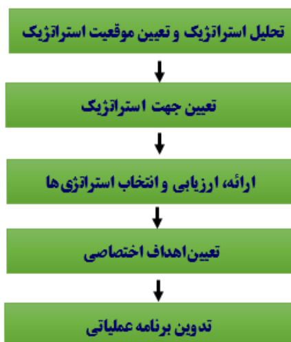
شکل ۱. مدل برنامه ریزی استراتژیک مورد استفاده برای توسعه رشته دانشگاهی ارگونومی

پژوهش حاضر با هدف تدوین برنامه استراتژیک توسعه رشته ارگونومی در ایران انجام شد.