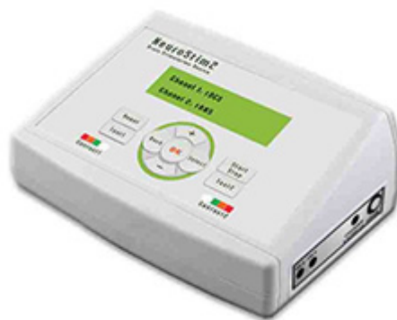
شکل ۳. دستگاه Neurostim2 (tDCS)

جدول ۱. نتایج مقایسه ی مقادیر میانگین و انحراف معیار نمرات متغیرهای غربالگری شده و سن بین گروه های مداخله و کنترل