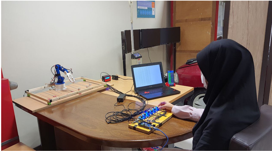
شکل ۲. ایستگاه کار هدایت بازوی رباتیک

گرفته و به محلول سدیم کلراید ۰,۹ درصد آغشته شدند تا ضمن افزایش رسانایی الکتریکی، مقاومت الکتریکی و عوارض جانبی ناشی از جریان کاهش یابد. بعد از قرار دادن پدها و پیش از اعمال تحریک، تست مقاومت جهت حصول اطمینان از اتصال الکترودها و شدت مناسب جریان عبوری انجام شد. در گروه مداخله، الکترودها با ابعاد ۵ * ۵ به عنوان الکترودهای فعال بر روی قشر حرکتی اولیه ی سمت چپ (C۳) و الکترودهای کاتد با ابعاد ۷ * ۵ به عنوان الکترودهای مرجع بر روی قسمت سوپرااوربیتال سمت راست (Fp۲) قرار گرفته و با استفاده از نوارهای کشی در مکان خود ثابت شدند. سپس جریان مستقیم ۲ میلی آمپر به مدت ۲۰ دقیقه برای آزمودنی اعمال شد. مدت زمان افزایش و کاهش تدریجی جریان در ابتدا و انتهای تحریک ۶۰ ثانیه بود. در این پروتکل تحریک یک بار انجام می شد. در گروه کنترل، مکان قرارگیری الکترودها مانند گروه مداخله بود با این تفاوت که به سبب همانند سازی ادراکات پوستی مانند خارش و سوزن سوزن شدن مرتبط با تغییر جریان و کورسازی آزمودنی ها از نوع تحریک دریافتی، جریان الکتریکی به تدریج در طول ۶۰ ثانیه ی اول وارد می شد اما در طول آزمایش جریانی اعمال نمی شد. در طول جلسات آزمودنی ها در هر دو گروه مداخله و کنترل از نوع تحریک دریافتی بی اطلاع بودند.