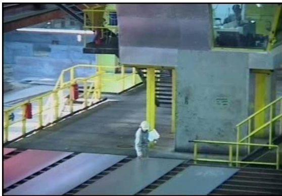
تصویر ۱: ثبت کد بر روی ورقه های نورد شده در بخش بسترهای خنک کننده

در ارتباط با کنترل تنش های گرمایی در قدم اول، لازم است با برنامه ریزی صحیح از مواجهه با شرایطی که می تواند منجر به تنش گرمایی شود، اجتناب نموده و یا اینکه آن را به حداقل رساند. اگر امکان عدم مواجهه با گرما وجود نداشته باشد، لازم است که میزان خطر، ترجیحاً از طریق کنترل های محیطی، به حد قابل قبول کاهش یافته و کنترل گردد. در مواردی که علی رغم کنترل های محیطی، احتمال تنش های گرما وجود داشته باشد، باید احتیاطات اضافی دیگری از قبیل به کارگیری معیارهای پزشکی در انتخاب و سازش افراد، تهیه نوشیدنی های مناسب جهت جلوگیری از کم آبی بدن، آموزش، محدود کردن دوره های کار و تامین لباس های حفاظتی حرارتی، می توان میزان مخاطرات را کاهش داد. از طریق تهیه