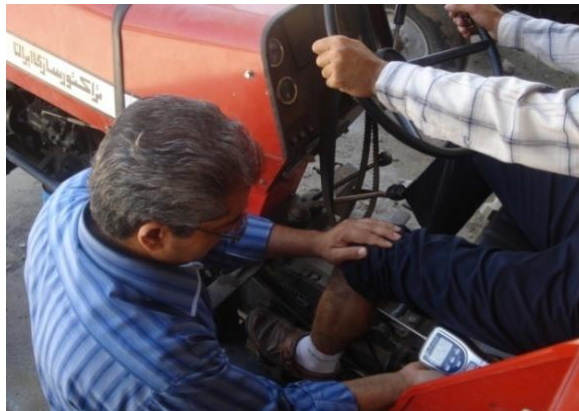
شکل ۱- استفاده از دستگاه الگومتر در ناحیه عضله گاستروکنیمیوس برای تعیین آستانه درد

درد کاربر در این مرحله نیز ثبت شد. کاهش آستانه درد عبارت است از: آستانه درد قبل از کلاچ‌گیری منهای آستانه درد کاربر بعد از کلاچ‌گیری. کاهش هر چه بیش‌تر آستانه درد نشان می‌دهد که عضله در فرآیند کلاچ‌گیری تحت تنش بیش‌تری قرار گرفته است. تمامی اندازه‌گیری‌ها با رعایت فواصل زمانی مناسب بین آزمایش‌های مختلف صورت گرفت. با توجه به این‌که کلاچ تراکتور MF285 دو مرحله‌ای است، برای جلوگیری از خطای احتمالی، با قرار دادن مانع فلزی زیر پدال از اعمال نیروی مازاد و رفتن به مرحله دوم کلاچ‌گیری جلوگیری شد. در تحلیل رگرسیونی مورد استفاده، تأثیر متغیرهای مستقل شامل: شاخص BMI، زاویه زانو، زاویه مچ و ران پا (به ترتیب X_1 ، X_2 ، X_3 و X_4 ) بر کاهش آستانه درد به‌عنوان متغیر وابسته (Y) بررسی شد. داده‌ها با استفاده از نرم‌افزار JMP4 تجزیه و تحلیل شدند.