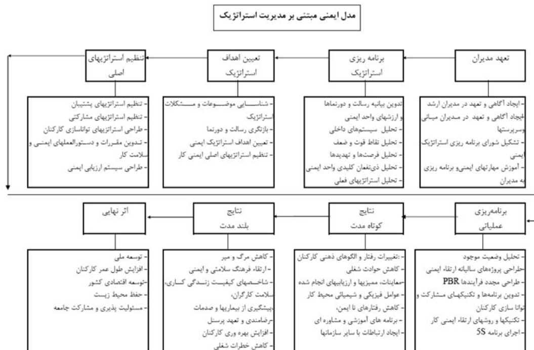
نمودار ۲- مدل ایمنی مبتنی بر مدل استراتژیک

استراتژیهای مناسب انتخاب کرد. این استراتژی ها می توانند شامل موارد زیر باشد: - توسعه معیارها و استانداردهای مناسب برای بهداشت حرفه ای و ایمنی - ساماندهی ساختار و تشکیلات ایمنی - تلاش در جهت ایجاد فرهنگ ایمنی در کلیه کارکنان - بهبود اثربخشی رویکردهای واحد ایمنی - تقویت بازرسی های مستمر محیطهای کار و کارکنان برای حفظ سلامتی آنها - ساماندهی خدمات آموزشی و مشاوره ای - گسترش آموزش، مشاوره و توسعه برنامه های مشارکتی برای کارفرماها و کارگران - تلاش در راستای تشبیت برنامه های تقویت سلامتی و ایمنی - ایجاد و توسعه ارتباطات با سایر موسسات و سازمانهای مرتبط با موضوعات ایمنی و سلامت کار مدیریت استراتژیک با تدوین استراتژی پایان نمی یابد. اینک باید برنامه را اجرا کرد و اجرای برنامه در قالب برنامه ریزی عملیاتی صورت می گیرد. پس هر