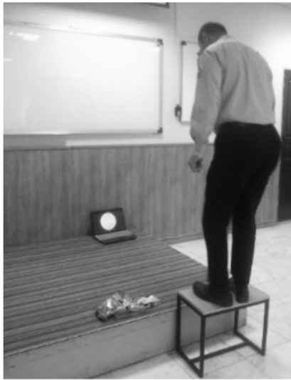
شکل ۱- یکی از افراد شرکت کننده در مطالعه در حین اجرای تست پله

در محیط اجرای آزمون نیز پزشک و همچنین فرد مسلط به کمک‌های اولیه جهت اطمینان از اقدام درمانی مناسب در صورت بروز علائم و اختلال در سلامت افراد در حین انجام تست حضور داشتند. به افراد شرکت کننده در مطالعه توضیح داده شد که در صورت بروز خستگی یا هر گونه وجود ناراحتی می‌توانند از اجرای ادامه آزمون انصراف دهند. اخذ رضایت‌نامه از نمونه‌های پژوهش، دادن اطلاعات کافی به هریک از نمونه‌ها، آزاد بودن کلیه واحدهای پژوهش در رد یا قبول شرکت در مطالعه و ایجاد اطمینان از محرمانه بودن اطلاعات واحدهای پژوهش از جمله موارد اخلاقی پژوهش بودند. برای تحلیل داده‌ها، از نرم‌افزار SPSS19 و روش‌های آمار توصیفی و استنباطی (آزمون‌های U من‌ویتنی، کروسکال والیس و ضریب همبستگی پیرسون) استفاده شد.