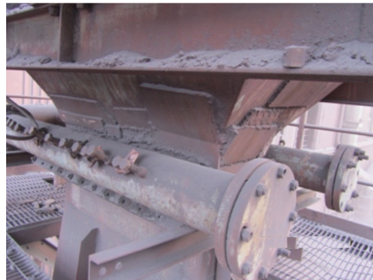
شکل ۱. خوردگی و ساییدگی سطح خارجی دور تا دور گلوبی ونچوری، عدم بسته بودن همه پیچ های درپچه های دسترسی روی بدنه اسکرابر ونچوری و درزندهای دارای نشی محل افشانک ها.

اسکرابر ونچوری مورد بررسی، فاقد هرگونه نشانگر بوده و متناسب با نوع فرایند انتخاب شده می باشد در بازرسی چشمی پالایشگر مشخص شد که سطح خارجی (دور تا دور گلوبی اسکرابر ونچوری) دارای ساییدگی و خوردگی می باشد و سطح داخلی بدنه اسکرابر در اثر سرعت بالای جریان در گلوبی، سایش و تماس با آب