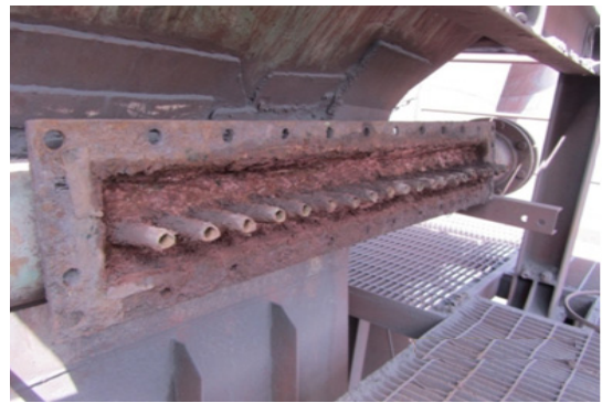
شکل ۲. افشانک های تغییر شکل یافته ناکارا که آب را بر گلوبی اسپری نمی کنند.

سرعت در کانال قبل از پالایشگر ۱۰ نقطه و در دودکش ۱۶ نقطه تعیین گردید (۲۸، ۱). در ادامه اطلاعات حاصل از اندازه گیری سرعت ثبت گردید. مقادیر سرعت که از قبل در محل های مورد نظر اندازه گیری شده بود بعنوان سرعت در پروب نمونه برداری ایزوکینتیک در نظر گرفته شدند. با توجه به در نظر گرفتن میزان جریان حجمی لازم توصیه شده در ایمپکتور آبخاری برای توزیع اندازه بعنوان میزان جریان حجمی در پروب ایزوکینتیک و سرعت اندازه گیری شده در کانال و دودکش، برای انتخاب سطح مقطع و قطر دهانه ورودی نمونه بردار نمونه برداری ایزوکینتیک از رابطه زیر استفاده گردید.