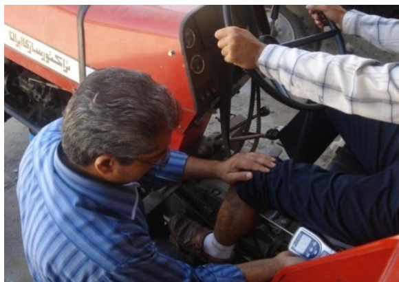
شکل ۱- استفاده از دستگاه الگومتر در ناحیه عضله گاستروکنیمیوس برای تعیین آستانه درد

درد کاربر در این مرحله نیز ثبت شد. کاهش آستانه درد عبارت است از: آستانه درد قبل از کلاچ‌گیری منهای آستانه درد کاربر بعد از کلاچ‌گیری. کاهش هر چه بیش‌تر آستانه درد نشان می‌دهد که عضله در فرآیند کلاچ‌گیری تحت تنش بیش‌تری قرار گرفته است. تمامی اندازه‌گیری‌ها با رعایت فواصل زمانی مناسب بین آزمایش‌های مختلف صورت گرفت. با توجه به این‌که کلاچ تراکتور MF285 دو مرحله‌ای است، برای جلوگیری از خطای احتمالی، با قرار دادن مانع فلزی زیر پدال از اعمال نیروی مازاد و رفتن به مرحله دوم کلاچ‌گیری جلوگیری شد. در تحلیل رگرسیونی مورد استفاده، تأثیر متغیرهای مستقل شامل: شاخص BMI، زاویه زانو، زاویه مچ و ران پا (به ترتیب X_1 ، X_2 ، X_3 و X_4 ) بر کاهش آستانه درد به‌عنوان متغیر وابسته (Y) بررسی شد. داده‌ها با استفاده از نرم‌افزار JMP4 تجزیه و تحلیل شدند.