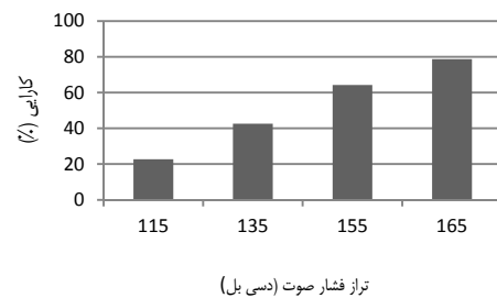
شکل ۲- تغییرات کارایی انباشت آکوستیکی در ترازهای مختلف فشار صوت

نتایج حاصل از آزمایش‌ها نشان داد که میانگین کارایی فیلتراسیون آکوستیکی به ترتیب در ترازهای فشار صوت ۱۱۵، ۱۳۵، ۱۵۵ و ۱۶۵ دسی‌بل برابر ۲۲/۷۵، ۴۲/۵۴ و ۶۴/۲۷ و ۷۸/۶۹ بدست آمد. نتایج آزمون آماری نشان داد که تفاوت معنی‌داری در میزان کارایی در ترازهای مختلف فشار صوت وجود دارد ( P=0/001 ).