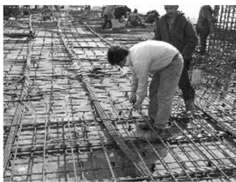
آرما توری بندی در حالت چمباتمه و پایین

است. همچنین ۹ فردی که برای انجام این آزمایش انتخاب شده‌اند دارای ابعاد آنتروپومتری بین صدک ۵ تا صدک ۹۵ هستند که این ملاحظه هم برای بررسی اثر ابعاد آنتروپومتری در ریسک کاری کارگران در کارهای مختلف مد نظر قرار گرفته است. فشار کاری مرتبط با هر کار و هر نفر (نیروی وارد به کمر) که از میانگین آزمایشات حاصل شده، در جدول شماره ۳ آمده است. پس از تعیین نیروی وارد بر کمر برای افراد و کارهای مختلف، می‌توان میزان ریسک کاری را در