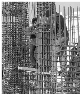
آرما توری بندی ایستاده و در ارتفاع شانه