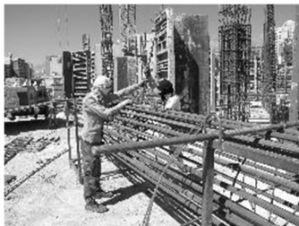
آرما توری بندی ایستاده و در ارتفاع کمر