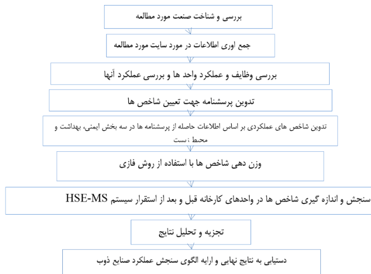
شکل ۱- الگوریتم مراحل انجام تحقیق

گری تفکیک شده اند. جهت کمی سازی وزن شاخص های عملکردی از روش فازی استفاده شده است. سپس به اندازه گیری شاخص ها در محیط مورد مطالعه پرداخته شده است. در نهایت با مشخص شدن میزان وزن شاخص ها با استفاده از روش های آماری بر اساس مستندات موجود در شرکت بین شرایطی که سیستم های HSE پیاده شده یا خیر با استفاده از آزمون T.testpair آنالیز گردیده است. در نهایت به بررسی شاخص ها در قبل و بعد از استقرار سیستم HSE-MS پرداخته می شود. بر این اساس مشخص می شود که ارتباط معناداری میان شاخص ها و عملکرد واحد HSE وجود دارد.