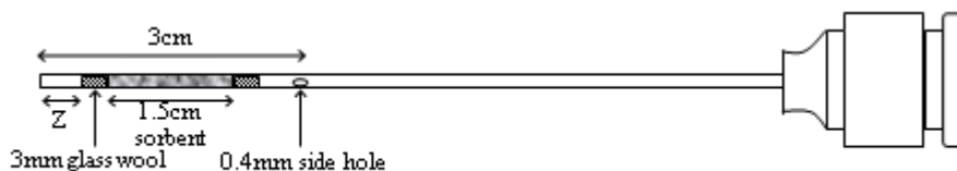
شکل ۲- طرح شماتیک از تله سوزنی با سوراخ جانبی و جاذب مهیار شده توسط پشم شیشه