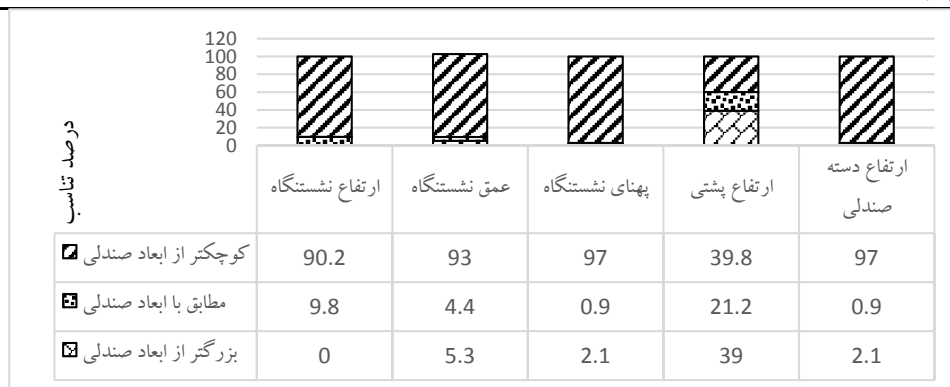
نمودار ۱- درصد تناسب ابعاد آنتروپومتریک دانش‌آموزان دختر پایه سوم با صندلی‌های مورد استفاده

ناچیزی با ابعاد دانش‌آموزان داشت (نمودارهای ۱ و ۲). ارتفاع نشستگاه صندلی برای دانش‌آموزان دختر و پسر پایه سوم به ترتیب ۴۳ و ۴۵ سانتی‌متر بود. با در نظر گرفتن صدک ۵ ارتفاع رگبی، این اندازه جهت طراحی صندلی ایده آل به ۳۱ سانتی‌متر کاهش داده شد و با افزودن ۲ سانتی‌متر پاشنه کفش به عدد فوق به ترتیب نسبت تناسب ابعاد صندلی مورد استفاده دانش‌آموزان با محدوده قابل قبول به ترتیب در دختران و پسران به ۹/۸ و ۴/۹ درصد رسید (نمودارهای ۱ و ۲). عمق نشستگاه صندلی‌های مورد استفاده برای پسران و دختران به ترتیب ۴۰ و ۴۱ سانتی‌متر بود. با در نظر