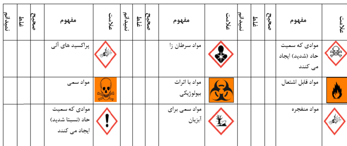
شکل ۱- نمونه‌ای از پرسشنامه بررسی درک علائم خطرات مواد شیمیایی (سامانه هماهنگ جهانی طبقه بندی و برچسب گذاری مواد شیمیایی) GHS و مقایسه آن با علائم قدیمی در گروه‌های مختلف مورد استفاده در این مطالعه

این مطالعه مقطعی بر روی کارکنان صنایع شیمیایی در شهر شیراز انجام شد. جهت برآورد حجم نمونه از فرمول اختلاف دو نسبت در جامعه استفاده گردید. مقدار ضریب اطمینان و توان آماری آزمون به ترتیب ۹۵ درصد و ۸۰ درصد در نظر گرفته شد و میزان اختلاف درک از علائم در این دو روش با توجه به نتایج مطالعات قبلی ۱۲ درصد در نظر گرفته شد. با در نظر گرفتن شرایط فوق حداقل حجم نمونه برای مطالعه