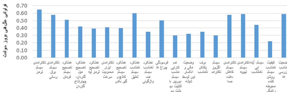
شکل ۳- علل فنی بروز حوادث در طی دوره ده ساله (۸۴-۹۴)

توجه: قابل قبول (۲); قابل تحمل (۱); غیر قابل تحمل (۰)