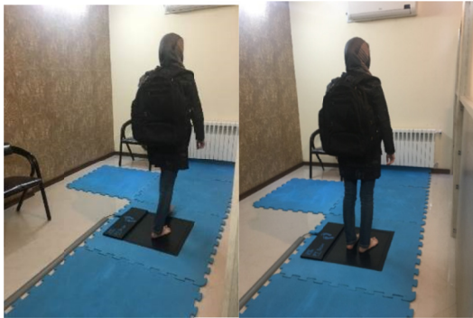
شکل ۳- ثبت فشار کف پا در حالت راه رفتن و استاتیک با کوله پشتی جدید ارگونومیک

اطلاعات و عدم استفاده از نام شرکت کنندگان رعایت گردید. آزادی نمونه‌ی مورد پژوهش حفظ و حق کناره‌گیری از مشارکت در هر زمان و در هر بخش از پژوهش برای آن‌ها در نظر گرفته شد و از شرکت‌کنندگان در پژوهش هزینه‌ای جهت انجام معاینات دریافت نشد.