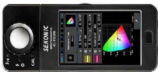
شکل ۱- دستگاه SEKONIC-7000

بینایی است و برای انجام کارهایی که نیاز به راحتی دید دارند آن است که روشنایی در سطح کار به صورت یکدست توزیع شود. در این مطالعه به منظور محاسبه شاخص یکدستی و مقایسه با مقادیر استاندارد، از فاکتور نسبت یکنواختی ( Emin/Eavg )، برای توزیع شدت روشنایی استفاده شد و برای ارزیابی وضعیت روشنایی محیط کار مورد استفاده قرار گرفت. اگر مقدار به دست آمده برای شاخص یکدستی توزیع شدت روشنایی کمتر از 0/6 باشد، باعث ایجاد مشکلات و اختلالات دید می شود که برای روشنایی فضاهای بسته و اتاق های کار مهم است (۶). معیار ورد به مطالعه نداشتن سابقه جراحی چشم و مشکلات بینایی (آب مروارید آستیگماتیسم و ...) و تمایل به ادامه همکاری تا پایان مطالعه بود. برای ارزیابی خستگی بینایی از پرسشنامه خستگی بینایی که روایی و پایایی آن مورد تأیید است استفاده شد (۲۴). پرسشنامه سنجش خستگی بینایی یک ابزار ۱۵ گویه ای است که با داشتن ۴ مؤلفه میزان خستگی بینایی را در کارکنان مورد ارزیابی قرار می دهد. نمره گذاری این پرسشنامه بر اساس طیف لیکرت و از ۰ تا ۱۰ و از وجود ندارد تا بسیار شدید درجه بندی شده است. مؤلفه های پرسشنامه شامل: استرس چشمی (جمع سؤالات ۱-۴-۱۱-۱۴)، اختلال دید (جمع سؤالات ۷-۸-۱۲-۱۳-۱۵)، اختلال سطح چشم (جمع سؤالات ۶-۹-۱۰) و مشکلات خارج چشمی (جمع سؤالات ۲-۳-۵) هستند. مجموع امتیازات این سؤالات محاسبه و سپس بر ۱۵ تقسیم می شود. نمره ۰ تا ۴ خستگی بینایی کم و نمره ۵ تا ۱۰ خستگی بینایی زیاد است. در جدول ۱ سؤالات مربوط به پرسشنامه خستگی بینایی آمده است. تحلیل داده ها با استفاده از نرم افزار SPSS 21 انجام شد و از روش های آمار توصیفی و آزمون استقلال دو متغیر کیفی توزیع کای دو استفاده شد.