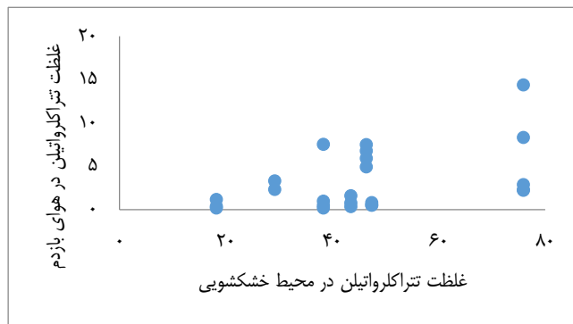
شکل ۲- نمودار پراکنش غلظت تتراکلرواتیلن در هوای بازدم و محیط خشکشویی در فصل تابستان بر حسب ppm