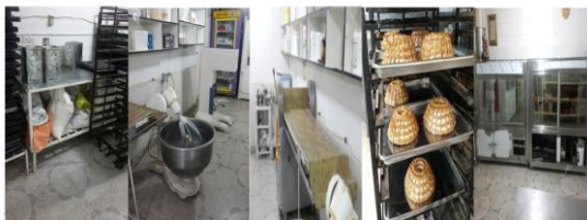
شکل ۱- فرآیند تولید محصولات قنادی الف: مواد اولیه ب: دستگاه مخلوط کن ج: دستگاه پهن کن د و ه: آماده سازی جهت عرضه به بازار

در مطالعه حاضر ابتدا با مشاهده پرونده پزشکی و انجام مصاحبه، کارگران از وجود هر نوع بیماری و مصرف دارو پایش شدند و چنانچه دارای بیماری‌هایی از قبیل: عفونت یا تب، مشکلات ریوی، کلیوی، قلبی - عروقی، پرکاری غده تیروئید، دیابت، اسهال یا استفراغ، سابقه ابتلا به بیماری‌ها و اختلالات ناشی از مواجهه با گرما و همچنین مصرف داروهایی از قبیل: بتابلوکرها، فنوتیازین، دیورتیک، آنتی کوسینرژیک، آنتی اسپاسمودیک، سایکوتروپیک، آنتی هیستامین‌ها، ضد