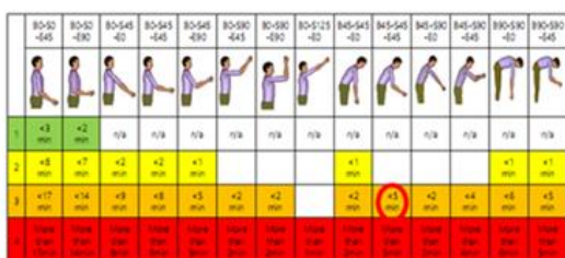
ارزیابی اندام فوقانی کشاورزان (AULA)