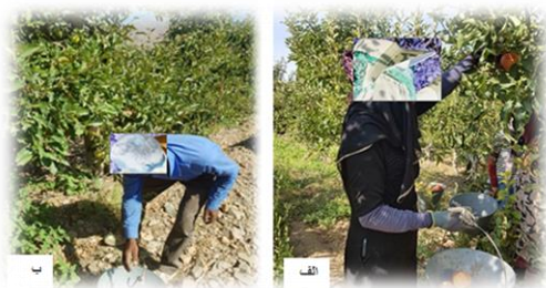
شکل ۱- نمایی از وضعیت‌های کاری میوه‌چینان الف) چیدن میوه از درخت ب) گذاشتن میوه در سطل

روش‌های تجزیه و تحلیل داده‌ها: به‌منظور تجزیه و تحلیل داده‌ها از نرم افزار آماری SPSS نسخه ۱۶ استفاده شد. جهت توصیف داده‌ها از آماره‌های توصیفی مانند میانگین و انحراف معیار استفاده شد. به‌منظور بررسی توزیع نرمال داده‌های جمع‌آوری شده از آزمون کولموگراف اسمیرنوف استفاده شد. به‌منظور مقایسه میانگین متغیرهای کمی در دو گروه دارای ناراحتی و