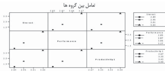
شکل ۲- بررسی ارتباط بهره‌وری و سه عامل رضایت شغلی، استرس و وفاداری

همانطور که ابزری وسرایداران معتقدند اگر فشار استرس به میزان کم تا متوسط باشد، توان فرد را در نشان دادن واکنش افزایش می‌دهد. در آن حالت اغلب