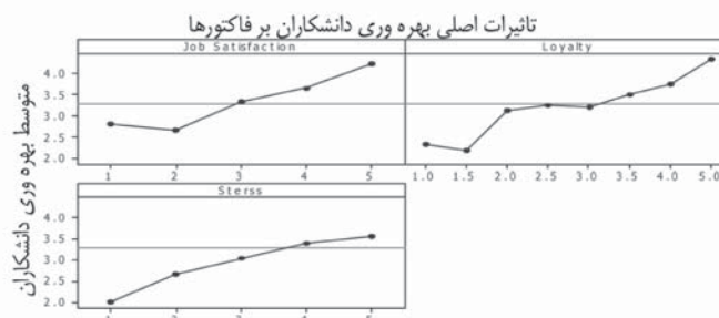
شکل ۱- بررسی ارتباط بهره‌وری دانشکاران و سه عامل رضایت شغلی، استرس و وفاداری

با توجه به جدول فوق مشاهده می‌شود که در گروه چهار برنامه‌نویسان کامپیوتر بهره‌وری دانشکاران بیشترین میزان را دارد. همچنین در این گروه رضایت شغلی و میزان استرس نسبت به سایر گروه‌ها در وضعیت مطلوب‌تری قرار دارد. بعد از گروه چهار، گروه ۳ (پژوهشگران) بالاترین میزان بهره‌وری دانشکاران را دارا می‌باشد و سپس در مرتبه سوم گروه ۲ (سرپرستان خط تولید) و در مرتبه آخر گروه ۱