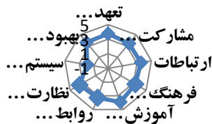
شکل ۳- میانگین امتیاز سازه های بخش فاکتورهای سازمانی ابزار

نمره فاکتور \times بار وزنی \Sigma = نمره شاخص عملکرد ایمنی (نمره فاکتور محیطی) 0.173 + (نمره فاکتور فردی) 0.324 + (نمره فاکتورهای سازمانی) 0.503 = نمره شاخص عملکرد ایمنی