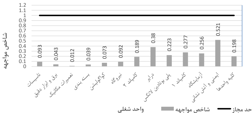
نمودار ۱- مقادیر شاخص مواجهه تنفسی با ۳،۱- بوتادین (E p ) در واحدهای شغلی مختلف

با مقدار ۰/۰۱۲ تعیین شد (نمودار ۱). نتایج بررسی میزان مواجهه تنفسی افراد مورد مطالعه با ترکیب ۳،۱- بوتادین برحسب نوع مشاغل (وظیفه شغلی) نیز تعیین کرد که بیشترین مقادیر مواجهه تنفسی در وظایف شغلی کارشناس آنالیز دستگاهی، سرپرست ایمنی و آتش نشانی، خدمات واحدهای پلی بوتادین لاتکس و درایر، ایمنی و آتش نشانی، کارشناس کالیبراسیون صنعتی، کارشناس کالیبراسیون آزمایشگاه و تکنسین ارشد مکانیک و ماشینری به ترتیب با مقادیر ۲۹۳۹/۳، ۲۴۳۱، ۱۹۰۰/۶، ۱۷۹۰/۱، ۱۳۲۶، ۱۰۳۸/۷ و ۸۸۴ میکروگرم بر مترمکعب وجود دارد. مقدار و شاخص مواجهه در وظایف شغلی مذکور در نمودار ۲ ارائه شده است.