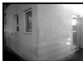
شکل ۴- نمونه مداخلات کنترل صدا در اتاق کنترل واحد تولید؛ سمت راست بعد از اصلاح و سمت چپ قبل از اصلاح