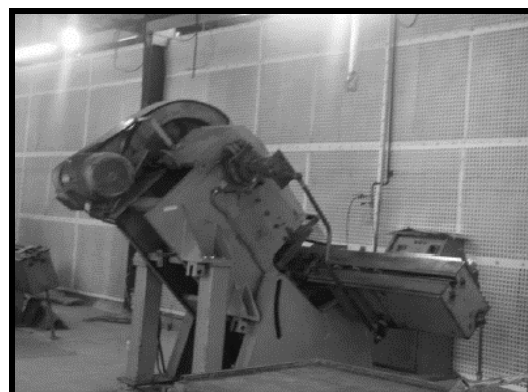
شکل ۳- نمونه مداخلات کنترل صدا؛ سمت راست اتاقک بطری‌ردیف‌کن، سمت چپ پانل جاذب صوت دیواری سالن پرس